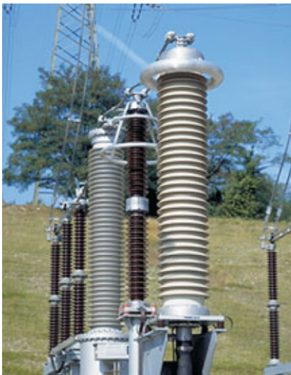
Picture 2 Outdoor termination 123...145 kV with composite insulator

Über die Jahre hat sich die Aufschiebe-Technik im Hochspannungsbereich ebenso erfolgreich bewährt wie im Mittelspannungsbereich. Die Feldsteuerung ist in dem vorgefertigten und vorgeprüften Aufschiebekonus integriert, und als äußerer Schutz werden Verbund-, Porzellan- oder Gießharzisolatoren verwendet.