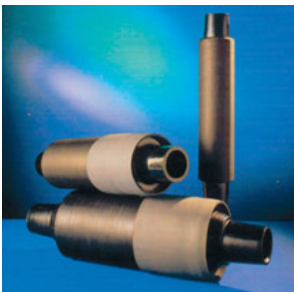
Picture 4 Joint bodies 123...145 kV

Lieferbar ist die Muffe mit oder ohne Schirmtrennung für Cross-bonding Anwendungen.