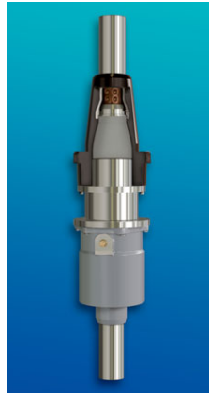
Picture 3 Switchgear termination 123...145 kV dry-type plug-in design