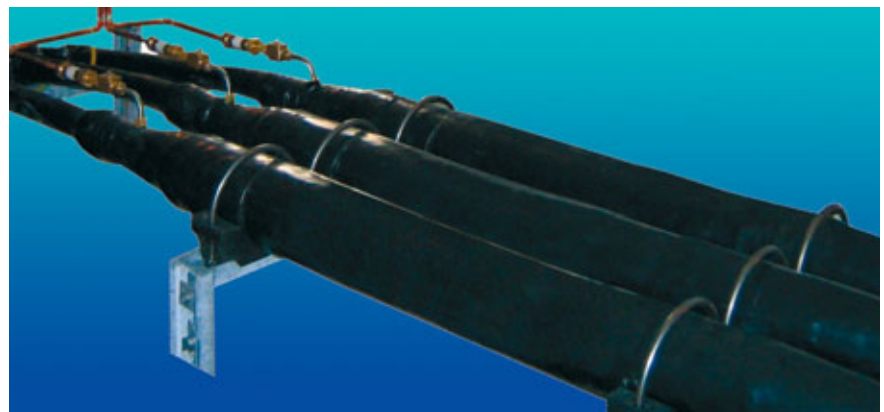
Picture 5 Transition joints 123...145 kV

Abbildung 5 Übergangsmuffen 123...145 kV